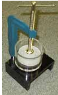
概寸：12×15×30cm 写真1 抽出器全景