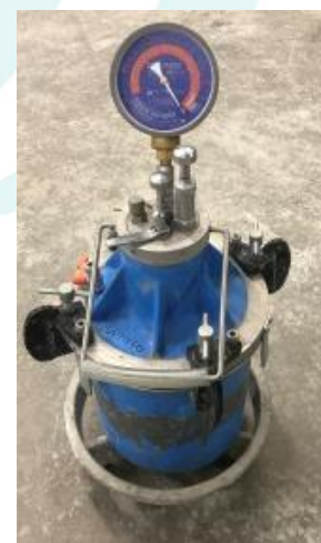
ワシントン型エアメータ

フレッシュコンクリートの試験においてスランプ試験と並行して空気量試験も行われます。空気量試験はJIS A 1116（質量方法）、JIS A 1118（容積方法）、JIS A 1128（空気室圧力方法）の3種類の試験方法が定められています。JIS A 1128では、ワシントン型エアメータを用いてフレッシュコンクリート中の空気量を測定します。空気量が1%増減するとスランプは約2.5cm増減します。このように、空気量は、コンクリートのワーカビリティに大きな影響をおよぼし、また、耐久性、強度などにも大きな影響を与えるので、空気量の管理は大切です。