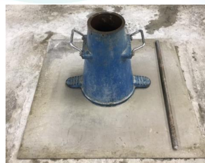
スランプ試験器具一式