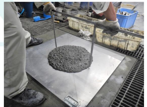
スランプフロー試験

スランプフロー試験はJIS A 1150「コンクリートのスランプフロー試験方法」に規定されています。スランプ試験とは異なり、コンクリートの高さではなく、広がりを示すフロー値によってコンクリートのコンシステンシーを評価します。高流動コンクリートや水中不分離性コンクリートなどの流動性が著しく大きく、スランプ試験では評価できないコンクリートについて行います。