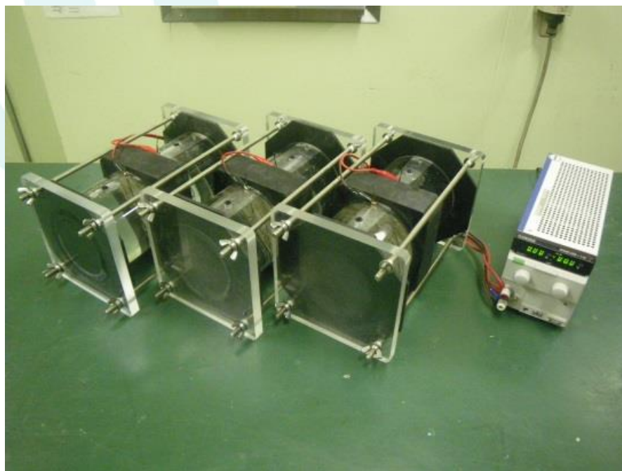
図 2 電気泳動試験機器

塩化物イオン濃度の測定は、両極のセル内から採取した溶液を、JIS K 0101 に準拠して測定します。