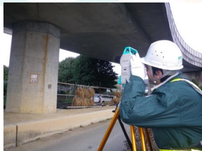
トータルステーション