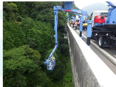
高所作業車による寸法計測

当社では、現場での寸法計測から図面の復元までの作業を一元して行うことで、スムーズで正確な図面作成を目指しています。