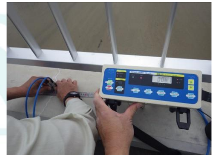
超音波法 (エルソニック)