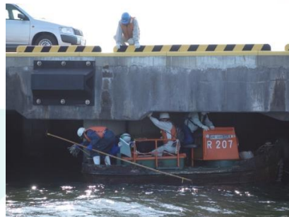
ボートによる寸法計測