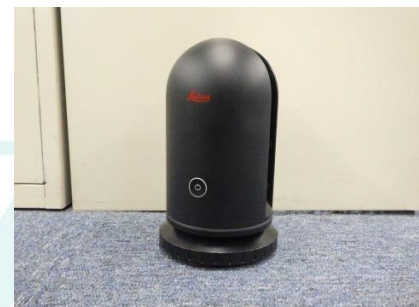
3D レーザースキャナ