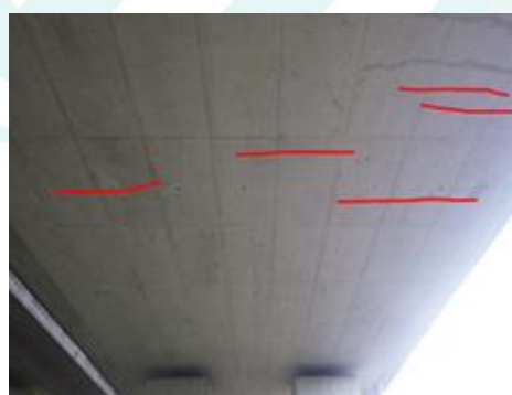
RC中空床版における曲げひび割れの例

この他、これらの要因を組み合わせた複合的な要因で発生しているひび割れも多く存在します。