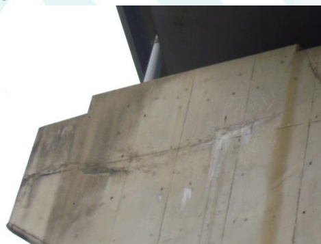
不適当な打ち継ぎに起因すると思われるひび割れの例