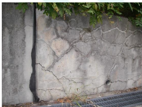
ASRに起因すると思われるひび割れの例