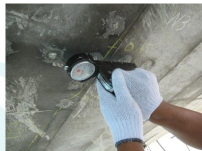
コンタクトゲージ法の例

進行性が疑われるひび割れにステンレス製のポイントを取り付け、コンタクトゲージと呼ばれる専用の計測機器を用いてひび割れ幅の経時変化を「1/1000mm 単位」で計測し、対象となるひび割れの進行性の有無や進行性の規模を測定する方法です。