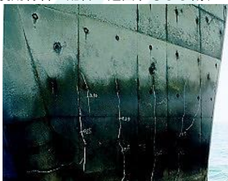
温度応力に起因すると思われるひび割れの例