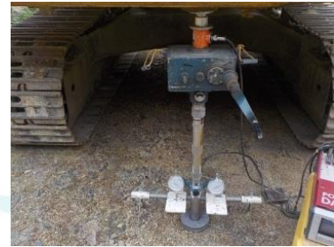
試験装置 (ロードセル・ダイヤルゲージ)