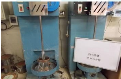
試験状況(供試体作製)

室内試験では、モールド(容器)内に締固めた材料(または乱れの少ない試料をモールドに入れた材料)に鋼製のピストンを一定速度で貫入し、一定の貫入量ごとに応力を測定します。現場では対象部位に直接同様の操作をします。貫入量が2.5mmと5mmの時の応力を標準荷重で除し、2.5mmの時の値をCBRとしますが、5mmの時のの方が大きい場合はその値をCBRとすることもあります。