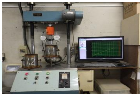
試験状況(貫入状況 1)