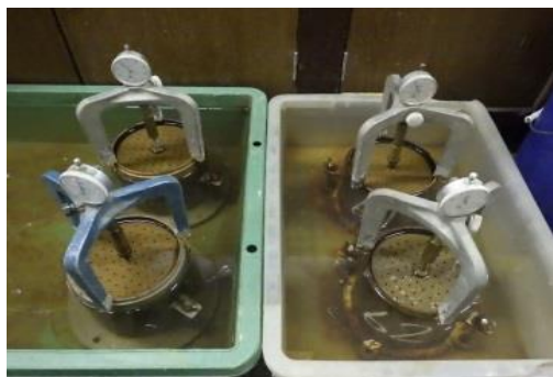
試験状況(吸水膨張試験)