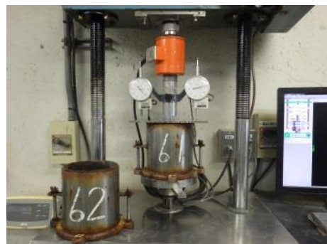
試験状況(貫入状況 2)