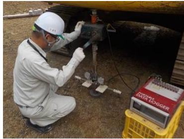
試験状況 (反力：バックホウ使用)

主にトラフィカビリティの評価や構築部位の品質確認に利用されています。また、乱れの少ない試料に直接測定可能なので、試料採取や成型が困難な場合は、室内試験よりも適しています。なお試験操作は室内と同様ですが、反力装置が必要です。