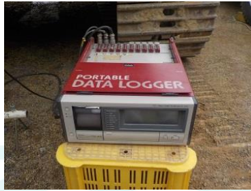
試験装置 (荷重・貫入量測定)