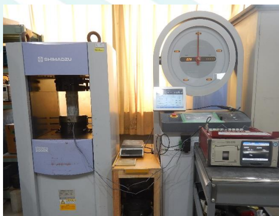
静弾性係数の計測状況例