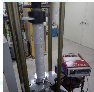
写真-1 円柱供試体試験状況

試験には、圧縮強度試験用、載荷用、無載荷(乾燥収縮ひずみ測定)用について、各3体ずつ計9体の供試体を使用します。専用の載荷装置を使用して供試体に持続応力(荷重)を作用させます。JIS A 1157では、供試体に作用させる応力は圧縮強度の1/3ですが、試験の目的によって変更も可能です。載荷持続期間中の供試体には、応力によって生じるクリープひずみに加え、乾燥収縮ひずみも生じます。このため、クリープひずみのみを求めるために、同様の供試体で乾燥収縮ひずみ(無載荷ひずみ)も同時に測定します。無載荷の供試体は載荷される供試体と乾燥条件を同等とする為に上下端面をシールします。載荷持続期間は1年以上とされています。