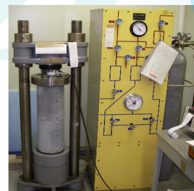
写真-2 遠心成形供試体試験状況