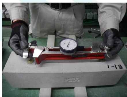
コンタクトゲージ法による測定