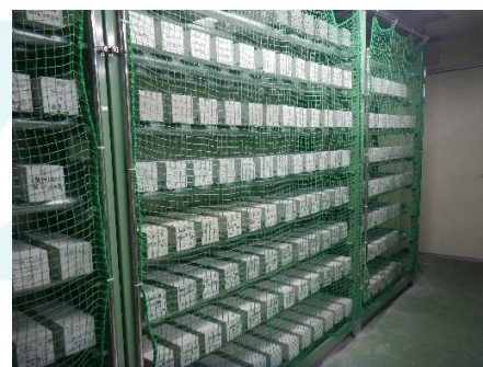
供試体の保管状況

供試体は、100×100×400mmの角柱供試体を用います。材齢7日まで水中養生を行い、この時点を目安とします。それ以後、周囲の温度を 20\pm 2^{\circ}\text{C} 、相対湿度を 60\pm 5\% に保った条件で保存し、乾燥期間6ヶ月(182日)または12ヶ月まで測定を行うのが一般的ですが、保存する環境や期間は、試験の目的に合わせて変更することも可能です。