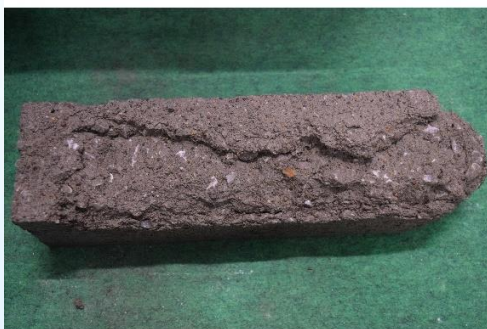
凍害によって劣化した供試体