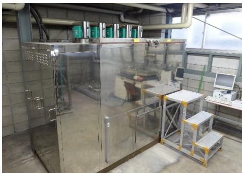
凍結融解試験装置の外観