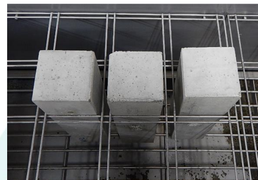
気中凍結水中融解法による試験状況 (B法 凍結行程)