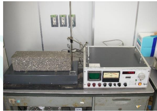
たわみ振動の一次共鳴振動数の測定