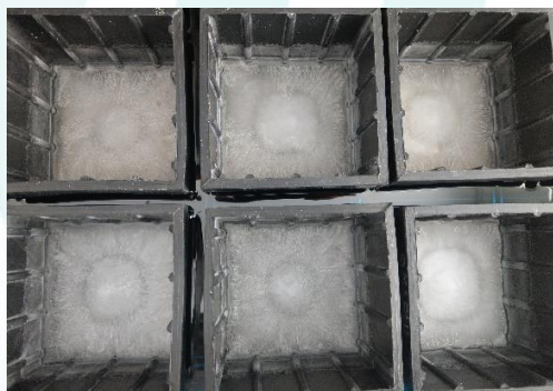
水中凍結融解法による試験状況 (A法 凍結行程)