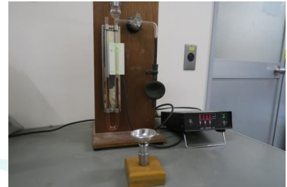
ブレン空気透過装置

メチレンブルー溶液が内部空隙を多く持つフライアッシュ中の未燃炭素に吸着しやすい性質を利用して、吸着したメチレンブルーの濃度減少量を、分光光度計を用いて吸光度により測定します。