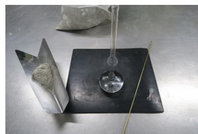
密度「ルシャテリエ法」

密度はフライアッシュの基本的な品質確認方法の一つであり、ルシャテリエ比重瓶を用いて測定します。