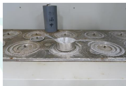
SiO 2 の定量

この \text{SiO}_2 がフライアッシュにどの程度含有されているかを、酸・アルカリ溶解による質量分析、または蛍光X線分析によって定量します。