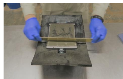
活性度指数用供試体作製

普通ポルトランドセメントを用いて作製した基準のモルタルフロー値を 100%とし、セメントの 25%をフライアッシュに置換したモルタルフロー値を比較し求めます。