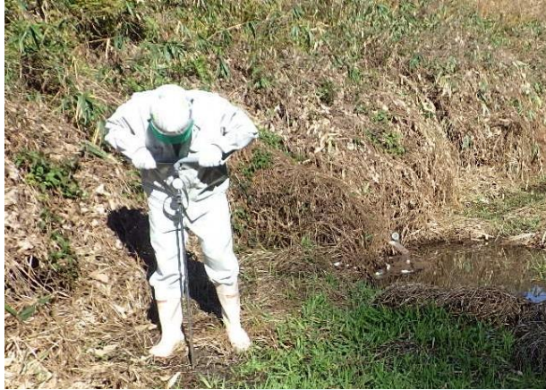
試験状況 (ポータブルコーン貫入試験)