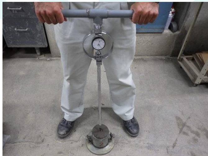
試験状況 (締め固めた土のコーン指数試験)

試験方法は2種類で、型枠に詰めた土のコーン指数を測定する「締め固めた土のコーン指数試験方法 (JIS A 1228)」と、現地盤にコーンを貫入させてコーン貫入抵抗を深さ方向に連続的に測定する「ポータブルコーン貫入試験 (JGS 1431)」があります。