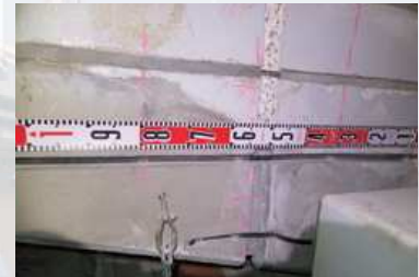
補修中（エルガード工法）

リフレドライショット工法 http://www.refre-dryshot.jp/