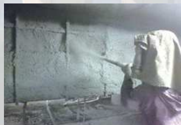
補修中（リフレドライショット工法）