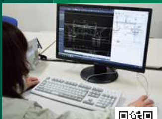
維持管理計画・ 補修設計