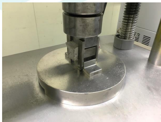
モルタルの圧縮強さの比の試験