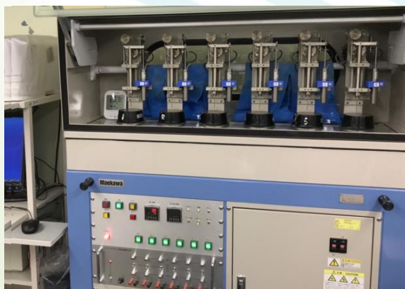
セメントの凝結試験（自動凝結試験機）