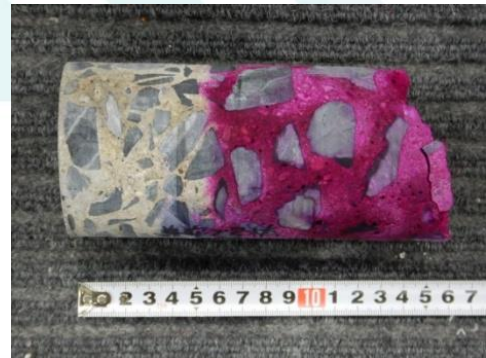
写真-1 中性化状況 (側面の場合)

また測定箇所粗骨材の粒子がある場合には、粒子または粒子の抜けたくぼみの両端の中性化位置を結んだ直線上で測定します。(図-1 参照)