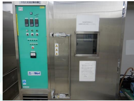
写真-5 促進中性化試験用装置