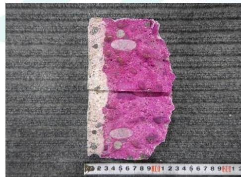
写真-2 中性化状況 (割裂面の場合)