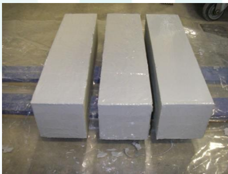
写真-4 エポキシ樹脂によるシール状況