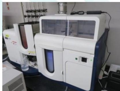
写真1. 原子吸光分析装置

各元素特有の波長の光を照射する際、他元素の光の吸収と重なることが少ないので、選択性に優れています。