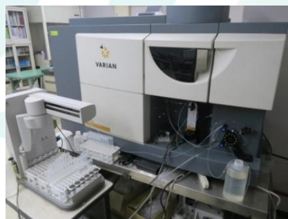
写真2. プラズマ発光分光分析装置