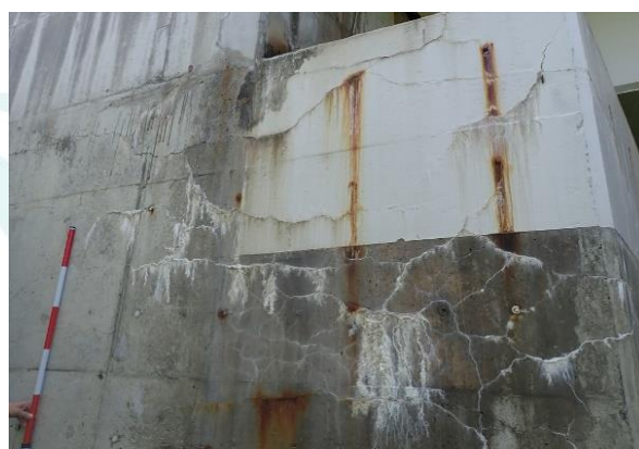
写真-1 ASRによる損傷（亀甲状のひびわれ）

コアを採取する際は、ひび割れなどが発生している箇所は避けて、少なくとも2本以上のコア採取が望ましいです。