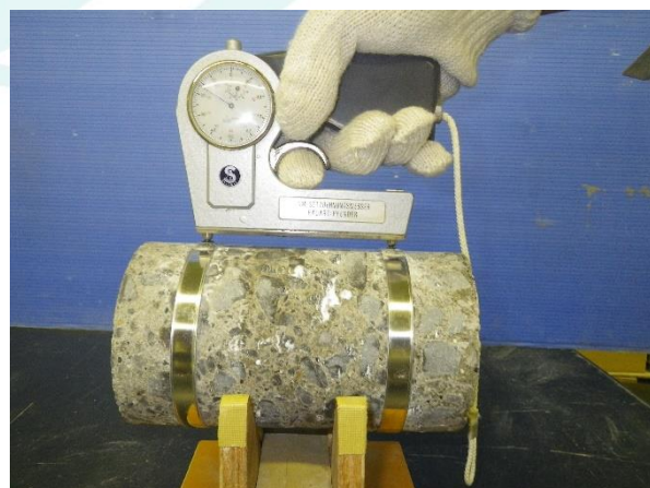
写真-3 促進膨張量試験

促進膨張量試験方法として、JIS-S-001-2017 (旧 JCI-DD2 法)、アルカリ溶液浸漬法 (カナダ法)、飽和 NaCl 溶液浸漬法 (デンマーク法) などがあります。