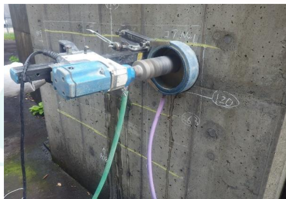
写真-2 構造物からコア採取